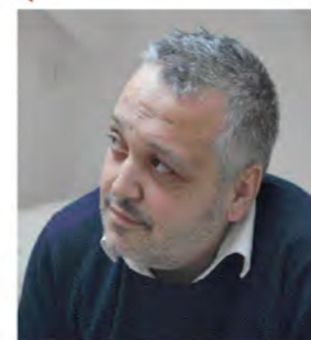
Progetto arch. Fabrizio Arcoini